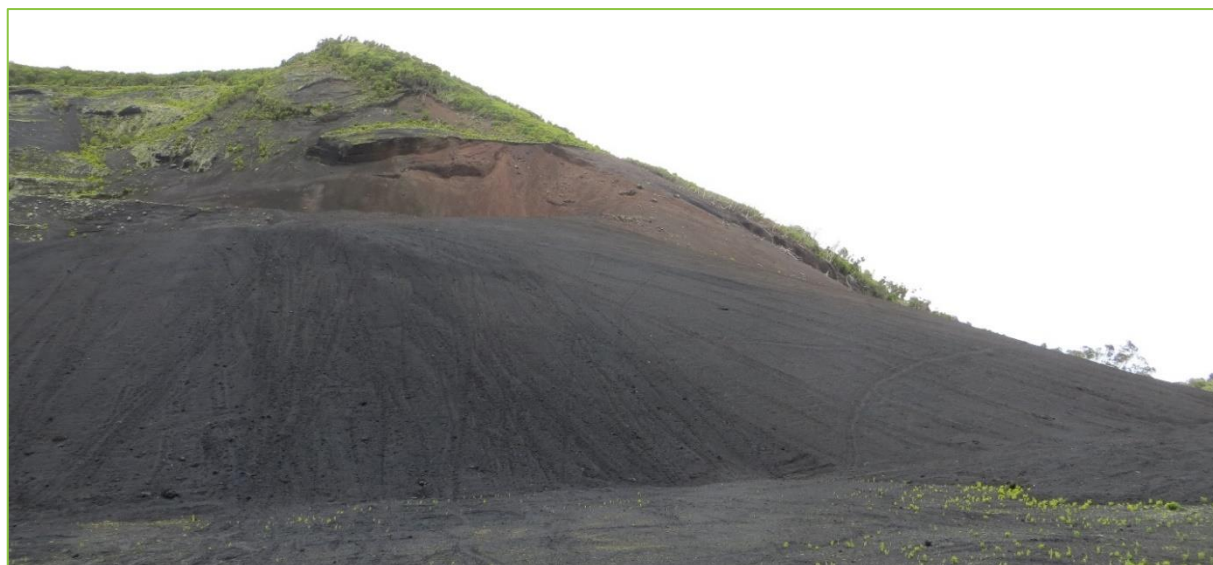
Figura 3 | Bagacina de granulometria fina (areias) e cor negra na área do projeto (novembro de 2018)

A área do projeto desenvolve-se, aproximadamente, entre os 385 e os 490 m de altitude, no flanco de um cone vulcânico, numa área onde é reconhecida a ocorrência de areias de bagacina de cor negra.