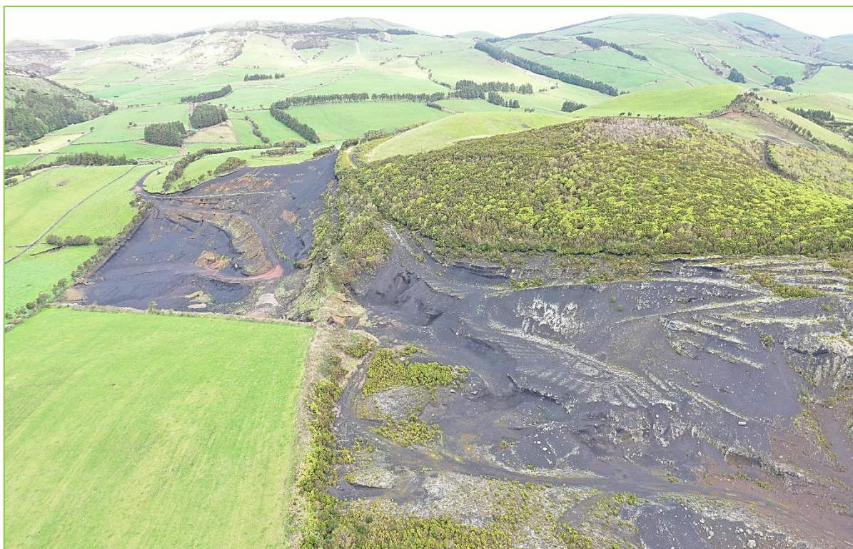
Figura 4 | Aspeto das zonas de escavação consolidada, pastagem e de ocupação florestal da área do projeto

Relativamente à fauna, de entre as espécies identificadas ou cuja ocorrência é considerada provável na área de estudo, seis são endémicas dos Açores e encontram-se abrangidas por instrumentos legais. No entanto, todas estas espécies possuem estatuto de conservação para a RAA de pouco preocupante ou desconhecido.